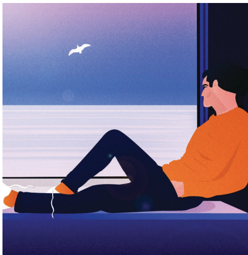
N. Kaan Gökçen, Quarantine, 2019