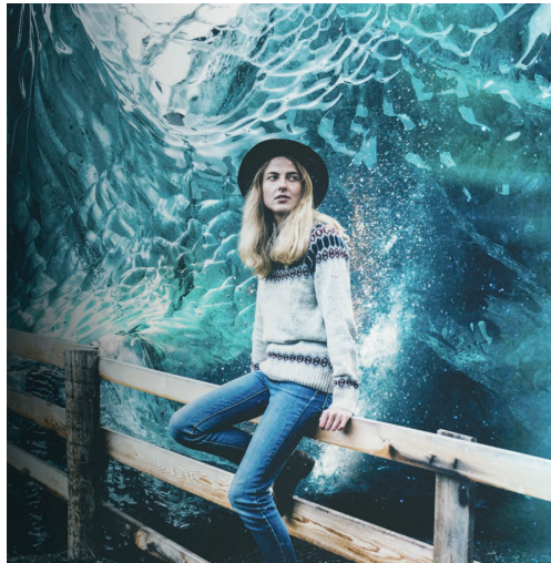
N. Kaan Gökçen, Foto Manipülasyon Çalışması, 2020