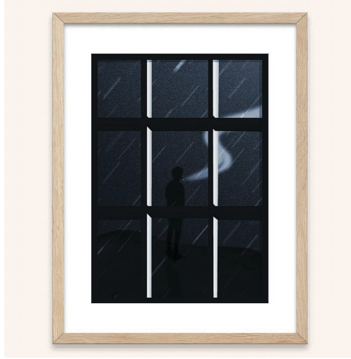
N. Kaan Gökçen, Night Shift, 2020