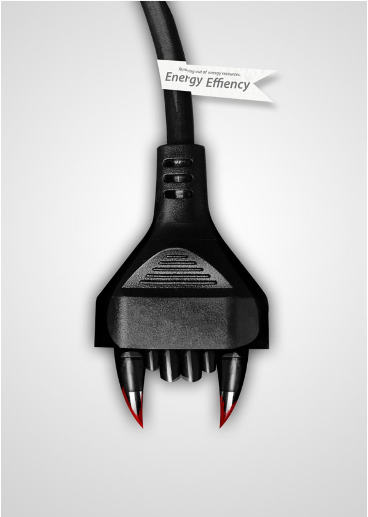
Enerji Verimliliği 70x100, 2012