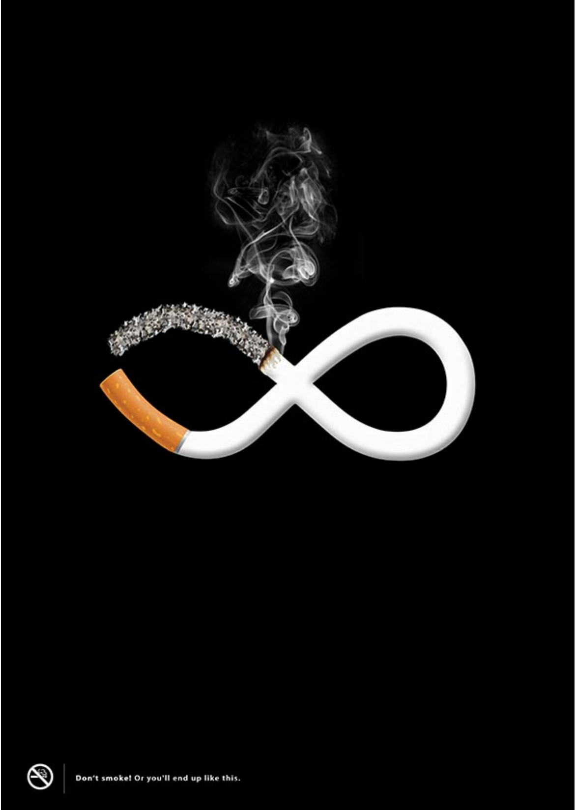
Sigara içme! Yada bunun gibi yok ol! 70x100, 2013