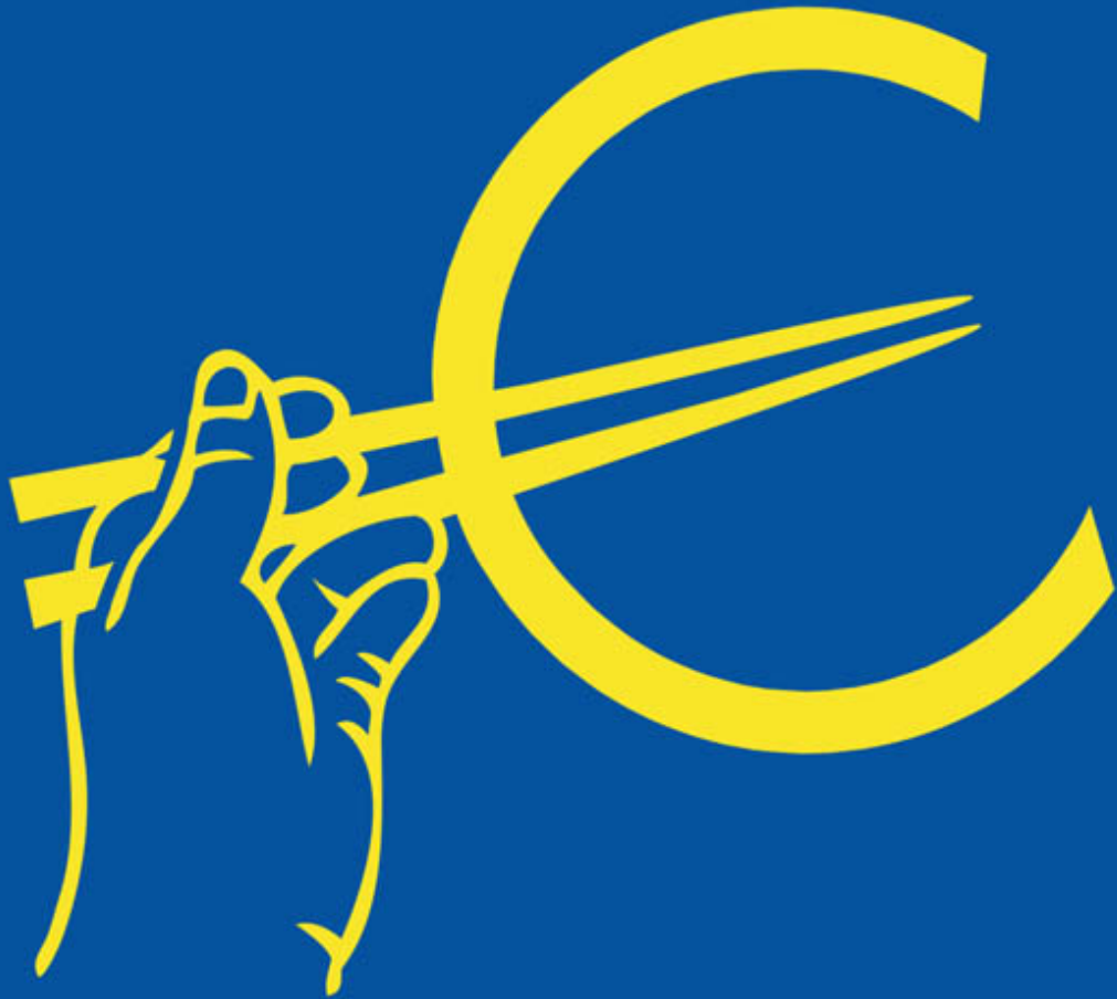
Globalizm 70x100, 2012